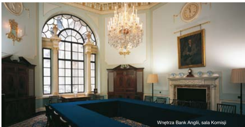
Wnętrze Bank Anglii, sala Komisji