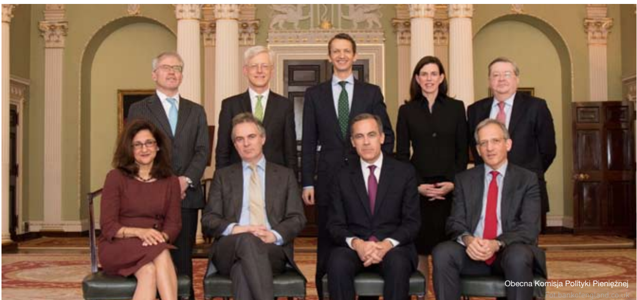
Obecna Komisja Polityki Pieniężnej