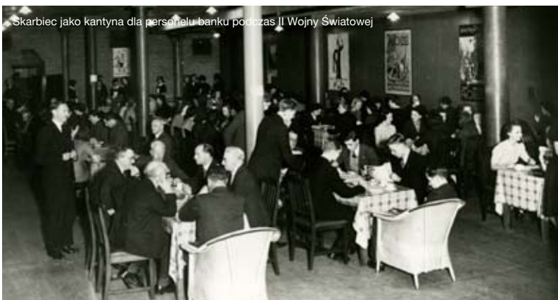
Skarbiec jako kantyna dla personelu banku podczas II Wojny Światowej