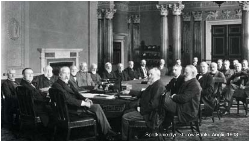
Spotkanie dyrektorów Banku Anglii, 1903 r.