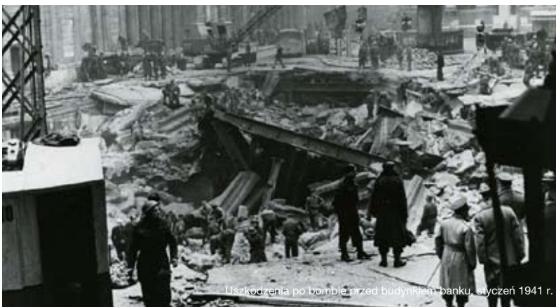
Uszkodzenia po bombie przed budynkiem banku, styczeń 1941 r.