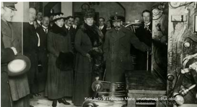
Król Jerzy V i Królowa Maria uruchamiają druk obligacji