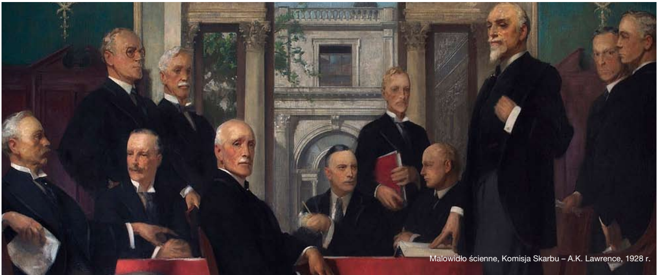
Malowidło ścienne, Komisja Skarbu – A.K. Lawrence, 1928 r.