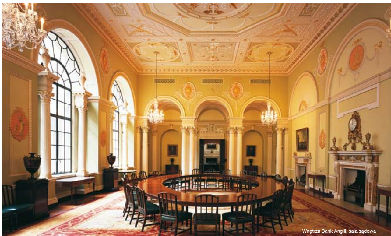
Wnętrze Bank Anglii, sala sądowa

rządu. Prudential Regulation Authority PRA (Urząd ds. Regulacji Ostrożnościowych) z kolei, sprawuje pieczę nad bankami, stowarzyszeniami budowlanymi, SKOKami, ubezpieczycielami oraz znaczącymi organizacjami inwestycyjnymi. W sumie, PRA kontroluje około 1700 organizacji finansowych. Zadaniem PRA jest kontrola nad bezpieczeństwem oraz rzetelnością tychże organizacji. Obecnie, tak jak w 1694 r. kiedy powstawał BoE, nadrzędną misją Banku Anglii jest sprawowanie pieczy nad dobrostanem obywateli UK. Celem polityki pieniężnej BoE jest stabilizacja cen oraz wspieranie celów gospodarczych rządu, takich jak wzrost oraz zatrudnienie, a także poprawa zaufania społeczeństwa do instytucji finansowych.