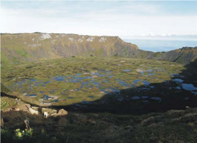
Krater Rano Kau