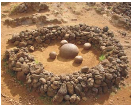
„Pępek Świata” z głazem o legendarnej mocy

Innym ważnym miejscem na wyspie jest drugi krater – Rano Kau – położony na południe od miejscowości Hanga Roa. W miejscu tym odnaleziono pozostałości wioski Orongo, w której wspiarsze odprawiali osobliwy kult człowieka-ptaka (tangata-manu). Ta uroczysta wioska składała się z 54 owalnych budynków zbudowanych z kamiennych płyt. Ich kształt i technika wykonania nawiązują do innych budynków często spotykanych na wyspie, a określanych jako hare-vaka, czyli domy-łodzie. Wejście do domu miało formę bardzo wąskiego tunelu, w którym mieściła się tylko jedna osoba. Wieś była używana