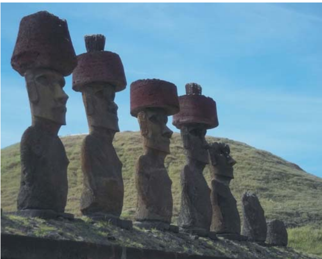
Moai przy plaży Anakena

Posągi wykuwano z tufów, pozyskiwanych z krateru wulkanu Rano Raraku. Ich powstanie może wiązać się z wierzeniami, według których posągi dawały moc dla żyjącego przywódcy rodu. W czasie pokoju zapewniały dostatek, a podczas wojny powodzenie.