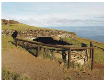
Przykład domu-łodzi w osadzie Orongo

kilka tygodni w ciągu roku, tylko na początku wiosny. Orongo jest także głównym miejscem na wyspie, gdzie znajdują się setki petroglifów przedstawiających ludzi-ptaki. Rzeźby te wykonano na skałach. Są to postacie człowieka z głową ptaka, który często w ręce trzyma ptasie jajko. Szacuje się, że wieś była używana od końca XVI wieku, chociaż wydaje się, że kult człowieka-ptaka rozwinął się w nieco późniejszym czasie. Rytuał tangata-manu odbywał się każdego roku. Wodzowie różnych plemion i ich przedstawiciele (hopu) rywalizowali w celu uzyskania pierwszego jajeczka rybitwy Manutara. Te ptaki przybywały każdej wiosny do gniazd na wysepkach Motu Nui, Motu Iiti oraz Motu Kao Kao zlokalizowanych u podnóża klifowego wybrzeża wyspy, na którym rozpościerała się wioska Orongo. Przed przybyciem ptaków przedstawiciele poszczególnych plemion przybywali do Orongo, gdzie przeprowadzano różne imprezy, które przygotowywały wybrańców do konkursu. Uczestnicy zawodów udawali się w dół klifu i dopływali do wysepki Motu Nui, na której przebywali przez kilka dni lub tygodni czekając na rybitwy. Okres pobytu na wysepce trwał do momentu, gdy jeden z uczestników znalazł jajko i jako pierwszy przybył do wioski. Rywalizacja