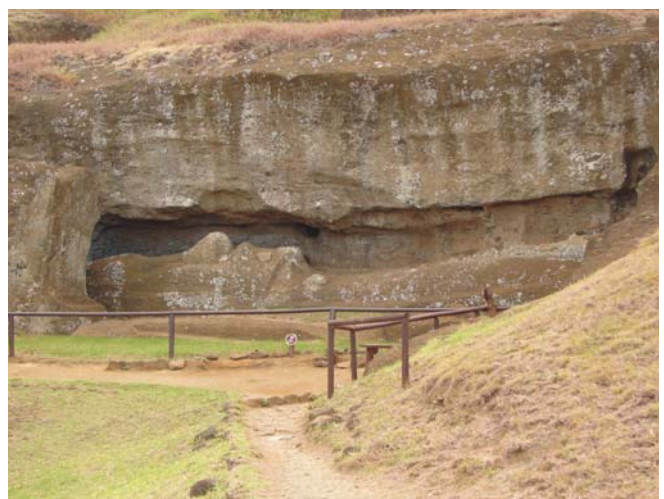
Nieukończony posąg moai w kamieniołomie Rano Raraku