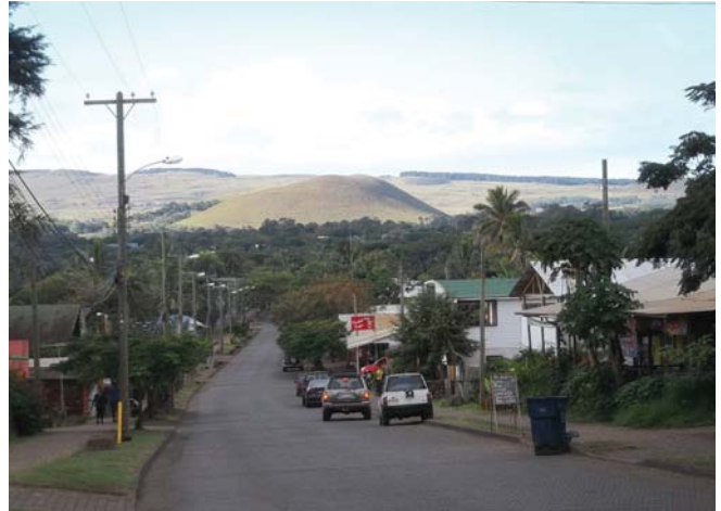
Hanga Roa – jedyne miasto na wyspie

uważa, że moai przedstawiają zmarłych wodzów lub bogów.