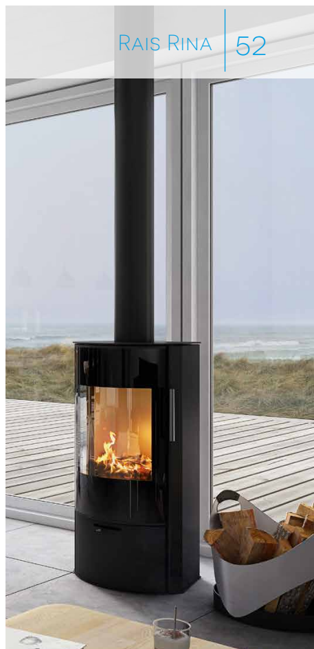
RAIS RINA 52