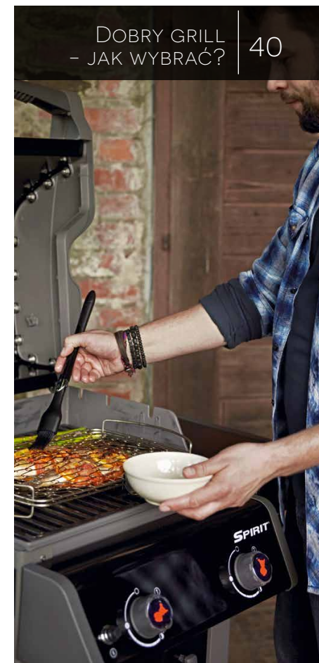
DOBRY GRILL - JAK WYBRAĆ? 40