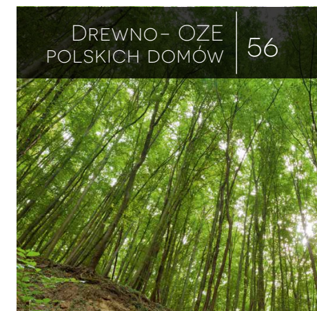
DREWNO- OZE POLSKICH DOMÓW 56