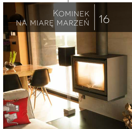
KOMINEK NA MIARĘ MARZEŃ 16