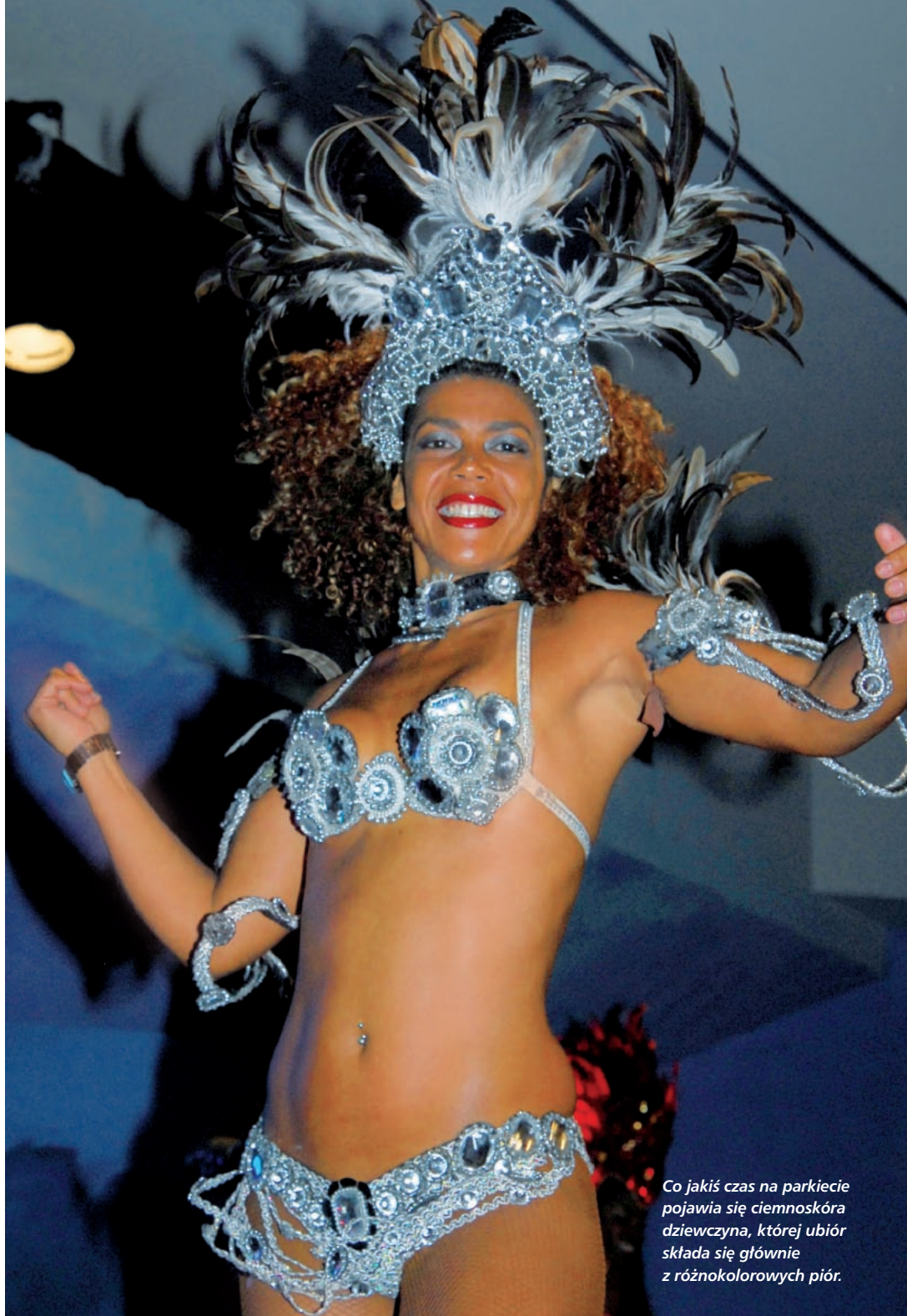
Co jakiś czas na parkiecie pojawia się ciemnoskóra dziewczyna, której ubiór składa się głównie z różnokolorowych piór.

W Brazylii – kraju wiecznego lata – istnieją tylko dwie pory roku: karnawału (rozpoczyna się w piątek wieczorem, kończy w środę rano) i przygotowań do niego. Kim są ludzie biorący w nim udział? Chłopiec przebrany za maharadzę czyści buty turystom u wejścia do parku Gavera. Strój cowboya ukrywa policjanta, a linoskoczek jest handlarzem narkotyków z ulicy Bota Fogo. Kobieta udająca baletnicę mieszka w slamsach w odległych favelach i jedynie raz na rok w czasie karnawału przyjeżdża na Avenida Vargas,