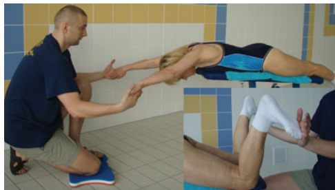
Fot. 5. Ćwiczenia pamięci mięśniowej nóg i ramion w stylu klasycznym z partnerem