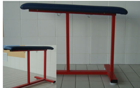
Fot. 13. Ławeczka pływacka projektu autorów

Tym wyposażeniem są gumy do ćwiczeń ramion i nóg. Gumy zakończono karabinkami do szybkiego ich montażu i demontażu (fot. 17, 18). Linki w przewodzie ochronnym wykorzystywane