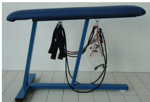
Fot. 19. Ławeczka z dodatkowym wyposażeniem