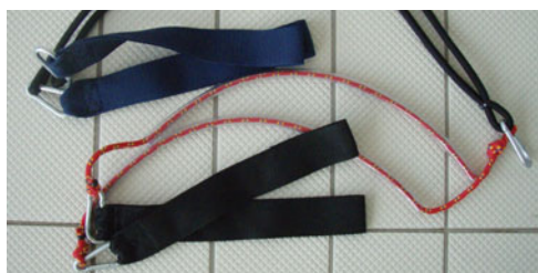
Fot. 18. Gumy i linki z uchwytami do nóg