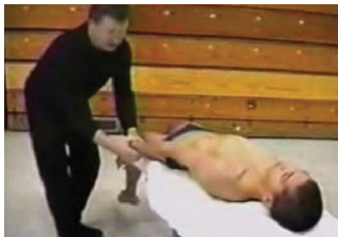
Fot. 2. Ćwiczenia pamięci mięśniowej w grzbiecie

nia do ich wykonywania przyborów i przyrządów. Dobrym przykładem może być propozycja ćwiczeń pamięci mięśniowej z zakresu nauczania techniki pływania autorstwa znanego w Polsce prof. Reina Haljanda 1 (fot. 1, 2).