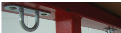
Fot. 16. Uchwyty do mocowania gum i lin pod kanapą