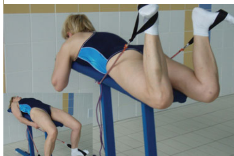
Fot. 8. Ćwiczenia kondycyjne nóg w stylu klasycznym z wykorzystaniem gum