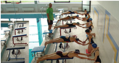
Fot. 11. Ćwiczenia pamięci mięśniowej ramion w stylu klasycznym grupy na ławeczkach