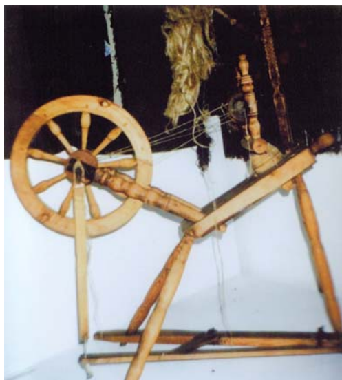
Kółko (kołowrotek) do przędzenia – Augustowskie Placówki Kultury, Muzeum Ziemi Augustowskiej