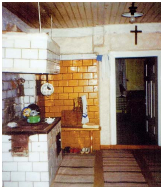
Wnętrze starego domu na wsi (Jezioriki), fot. Józefa Drozdowska

Materiał nauczania: Wiedza ucznia na temat znajomości używania dawnych przedmiotów użytku domowego występujących na terenie Augustowa.