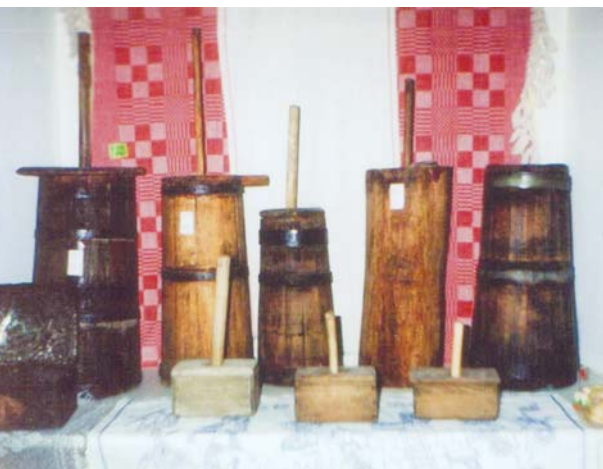
Maselnice (bojki) do masła z foremkami – Izba Regionalna Ziemi Sztabińskiej w Sztabinie