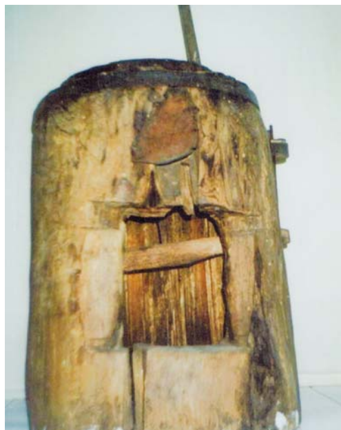
Żarna – Augustowskie Placówki Kultury, Muzeum Ziemi Augustowskiej, fot. Józefa Drozdowskiego

kołowrotek – najprostszy przedmiot słu- żący do przędzenia lnu i wełny;