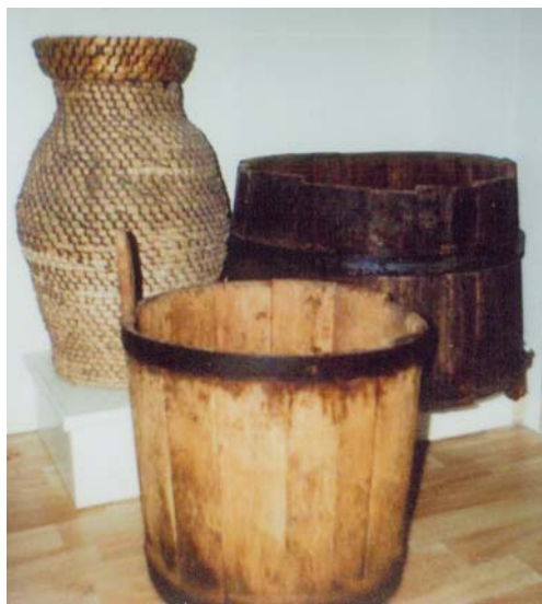
Ceberek – Izba Regionalna Ziemi Sztabińskiej w Sztablinie