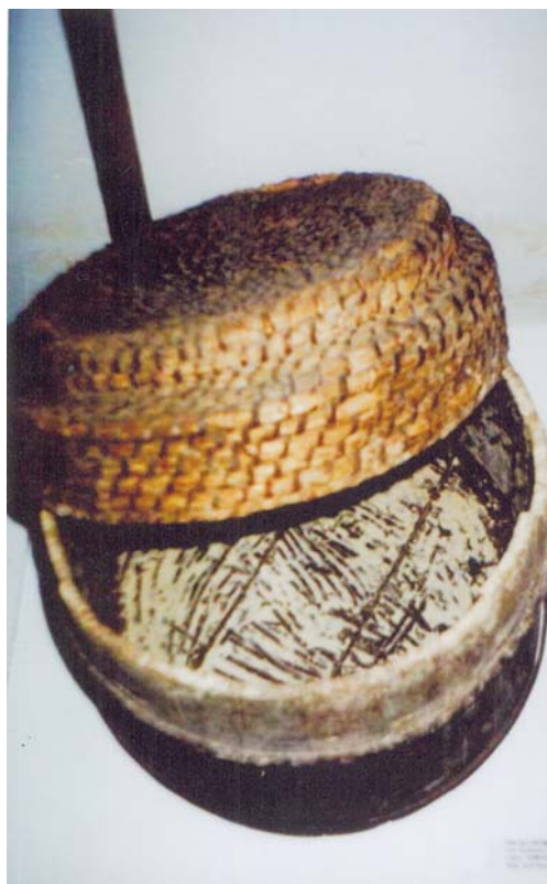
Dzieża – Augustowskie Placówki Kultury, Muzeum Ziemi Augustowskiej

Strategia nauczania–uczenia się: spotkanie z poetką mieszkającą w regionie, operacyjna.