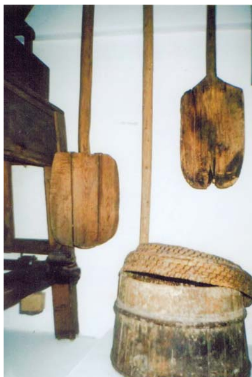
Dzieża i łopaty do chleba – Augustowskie Placówki Kultu- ry, Muzeum Ziemi Augustowskiej