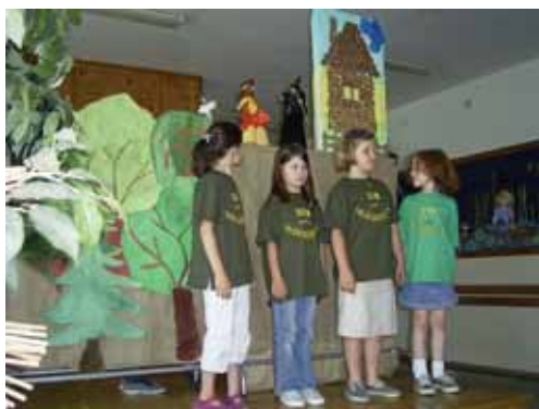
Przedstawienie kukielkowe „Jaś i Małgosia”