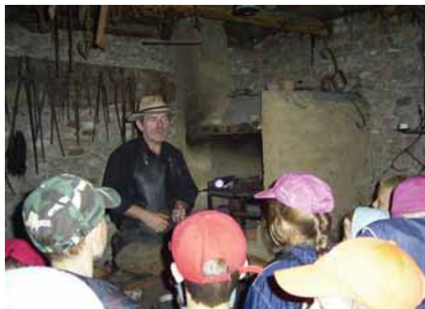
U kowala; wycieczka do skansenu wsi polskiej w Sierpcu

daliśmy z górki w pobliżu szkoły. Organizowaliśmy w ramach zajęć SKS-u wyjazdy na lodowiska, a w czasie ferii zimowych – jednodniowe wyjazdy w góry, za które płacili rodzice. Poza tym woziliśmy dzieci do najbliższego miasta na pływalnię.