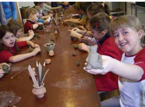
Na wycieczce w Muzeum Archeologicznym; lepienie z gliny