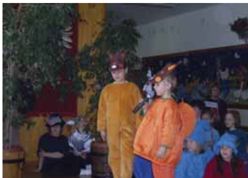
Przedstawienie z okazji Dnia Ziemi