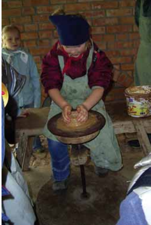
Skansen w Sierpcu; lepienie garnków

Od pewnego czasu ja sama prowadzę zajęcia dodatkowe: kółko teatralne. Wspólnie z uczniami aktorami przygotowujemy inscenizacje, widowiska lalkowe, przedstawienia okazjonalne. Dzieci z zapałem uczą się swoich ról, samodzielnie wykonują kukielki i niektóre elementy dekoracji – działają twórczo i zgodnie pracują w grupie rówieśniczej. Inscenizacja jako forma pracy lekcyjnej, jak i pozalekcyjnej, z dziećmi w młodszym wieku szkolnym wywodzi się z gier i zabaw, jest zatem dzieciom bliska i chętnie w niej uczestniczą. Dzięki takiej pracy dzieci uczą się odpowiedzialności zbiorowej i indywidualnej, bo wiedzą, że końcowy efekt – sukces z wystawienia inscenizacji – jest dziełem całej grupy.