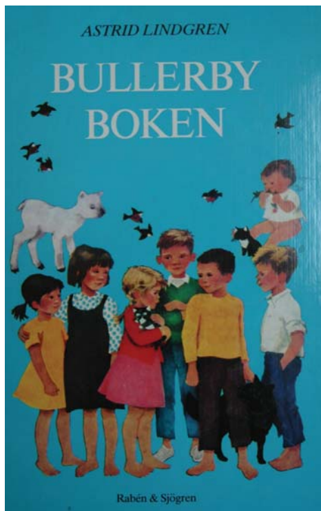
Okładka szwedzkiego wydania „Dzieci z Bullerbyn”. Egzemplarz ze zbiorów Muzeum Książki Dziecięcej w Warszawie