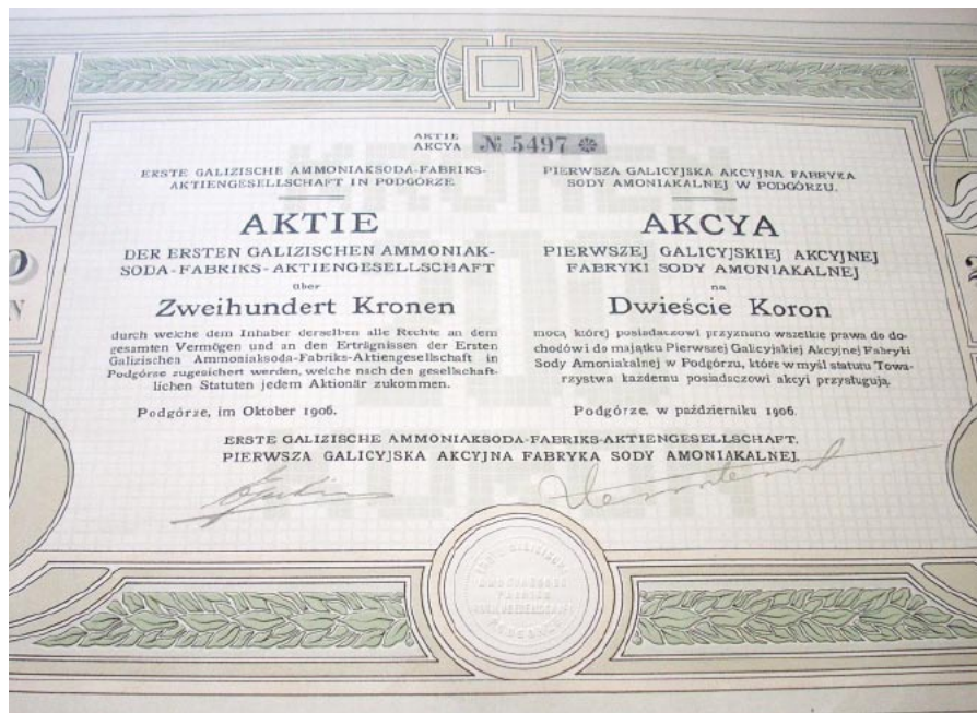
Akcja Pierwszej Galicyjskiej Akcyjnej Fabryki Sody Amoniakalnej.

Jedną z pionierskich amerykańskich spółek akcyjnych była istniejąca do dzisiaj Hudson Bay Company. Po raz pierwszy emitowała akcje w 1699 r. Zajmowała się handlem skórami dzikich zwierząt. I nadal, rozpoczynając doroczne Walne Zgromadzenie, prezes wita akcjonariuszy słowami: Witajcie, poszukiwacze przygód! W zasadzie niemal wszystkie większe przedsiębiorstwa – z różnych powodów – stawały się spółkami akcyjnymi. Właściciele wiedzieli bowiem, iż powinni wynajmować menedżerów, a nie kierować firmami samodzielnie. Zwłaszcza że były to grupy kapitałowe skupiające wiele firm funkcjonujących w różnych branżach. Z drugiej strony, taka działalność wymagała ogromnego kapitału. Stąd popularność spółek akcyjnych, które pozwalały na obracanie pieniędzmi nie tylko należących do właścicieli.