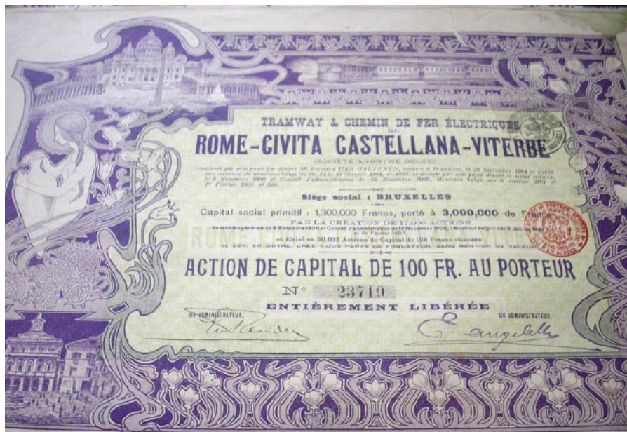
Akcja rzymskiego Towarzystwa Tramwajów i Kolei Elektrycznych.

Nie ma też pewności, kiedy wyemitowano pierwsze obligacje. Jeśli król pożyczal na procent pieniądze od szlachty, wystawiał na to pokwitowanie, czyli obligację. Tyle że obecnie obligację definiuje się jako pokwitowanie masowej pożyczki. Tak czy inaczej, można założyć, że obligacje znane są już od dawna, choć trudno wskazać dokładną datę pierwszej emisji. W zasadzie przyjmuje się, iż narodziły się w XIV–XVI w.