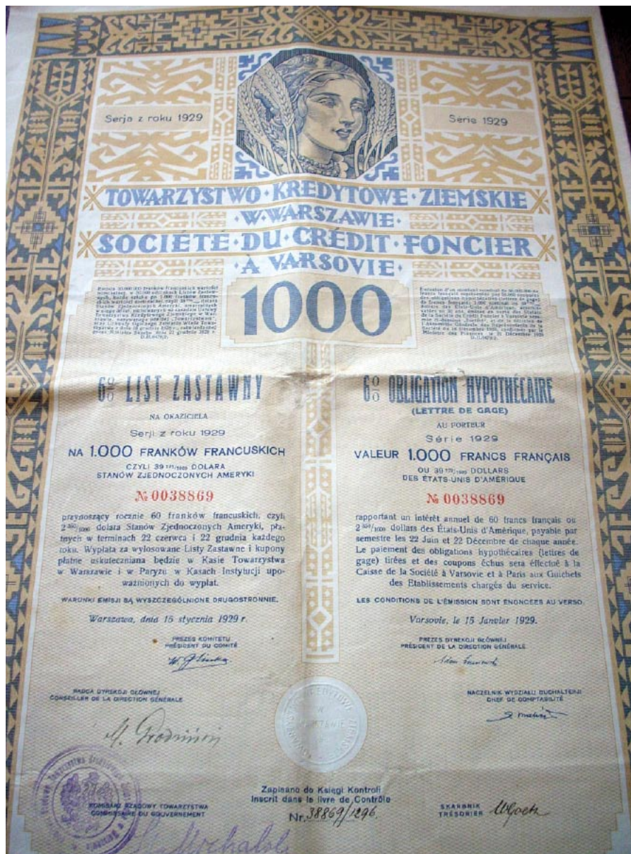
List zastawny Towarzystwa Kredytowego Ziemskiego (proj. Zofia Stryjeńska).