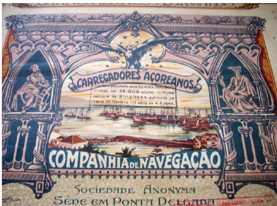
Akcja hiszpańskiego Towarzystwa Żeglugi z Ponta Delgada.

Ale w naszym kraju pierwszy zbiór – nawet do 200 papierów – można skompletować, kupując je po 20–100 zł. Natomiast XVIII-wieczne są praktycznie bezcenne. Po prostu nie ma ich w obiegu.