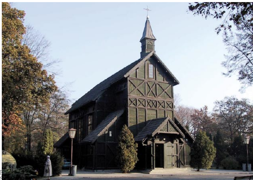
Warszawa – Bródno. Drewniany kościół św. Wincentego a Paulo wzniesiony w XIX wieku.

Odrzucone zostały odwieczne zasady definiujące miasto jako obszar koncentracji zabudowy. Zupełnie zanikł najefektyw-